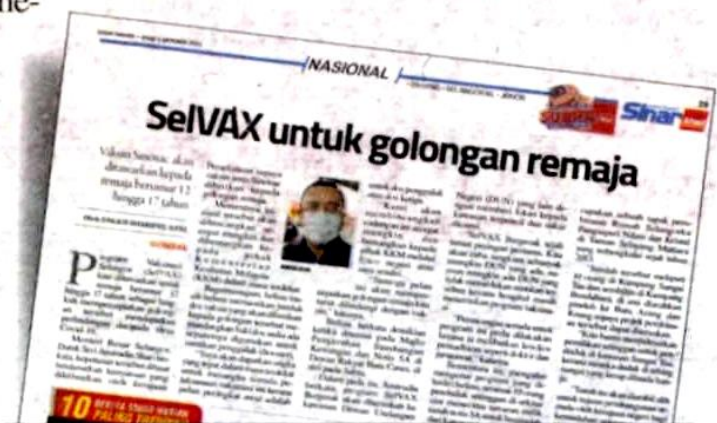
Laporan Sinar Harian pada 3 Oktober lalu.

“Sekolah di bawah JAIS akan diberi keutamaan dan mungkin kita juga boleh buka kepada sekolah rendah yang lain,” katanya.