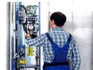
Repairing or replacing a lift is a costly affair

ABOVE Councils have little power to persuade owners to repair or refurbish dilapidated buildings.