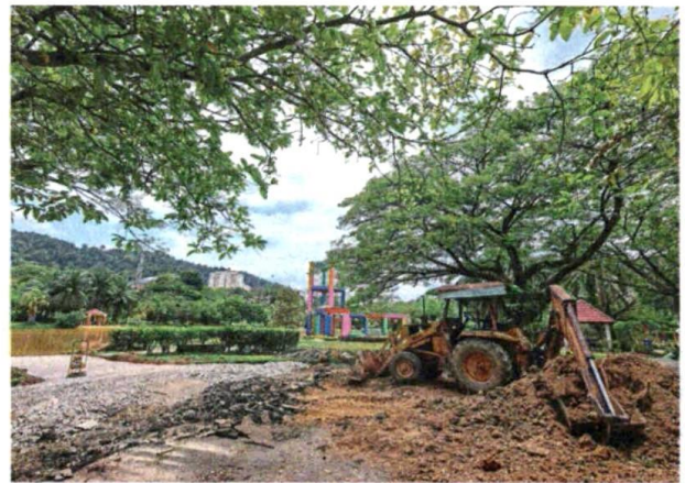
Besides deepening the lake at Taman Wawasan Recreational Park, cleaning and dredging works as well as installation of two aerator units are being carried out.

Several areas in the Klang Valley, including Taman Sri Muda in Shah Alam and Seri Kembangan, were hit by flash floods last month.