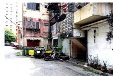
Who is responsible for sadly neglected low-cost apartments?