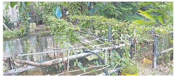
居民自行在大沟渠搭建行人桥,在沟渠旁空地种植蔬菜及养殖鸡鸭,因构成蚊虫问题,居民将被通知须自行清空。